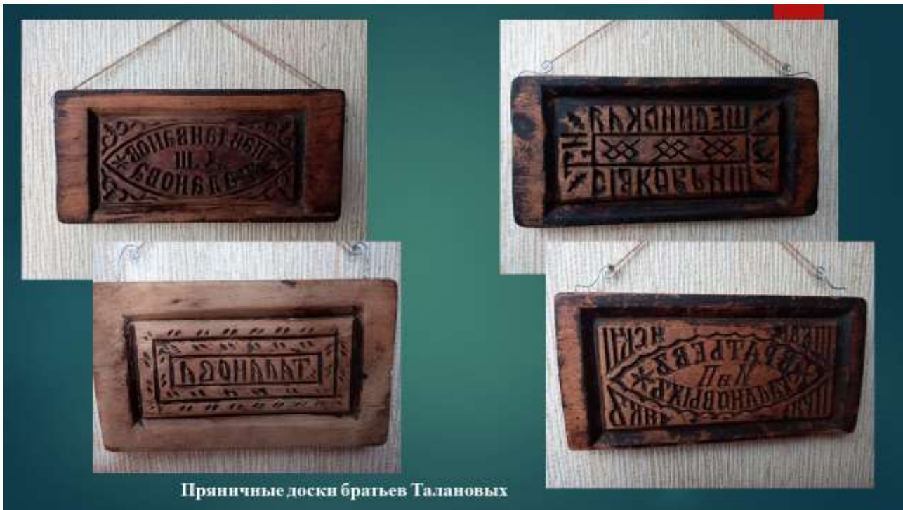
Пряничные доски братьев Талановых