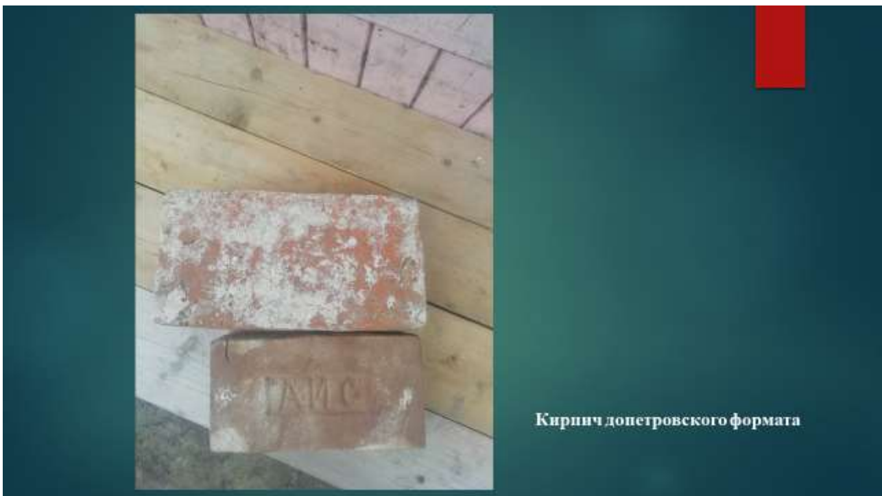
Кирпич допетровского формата